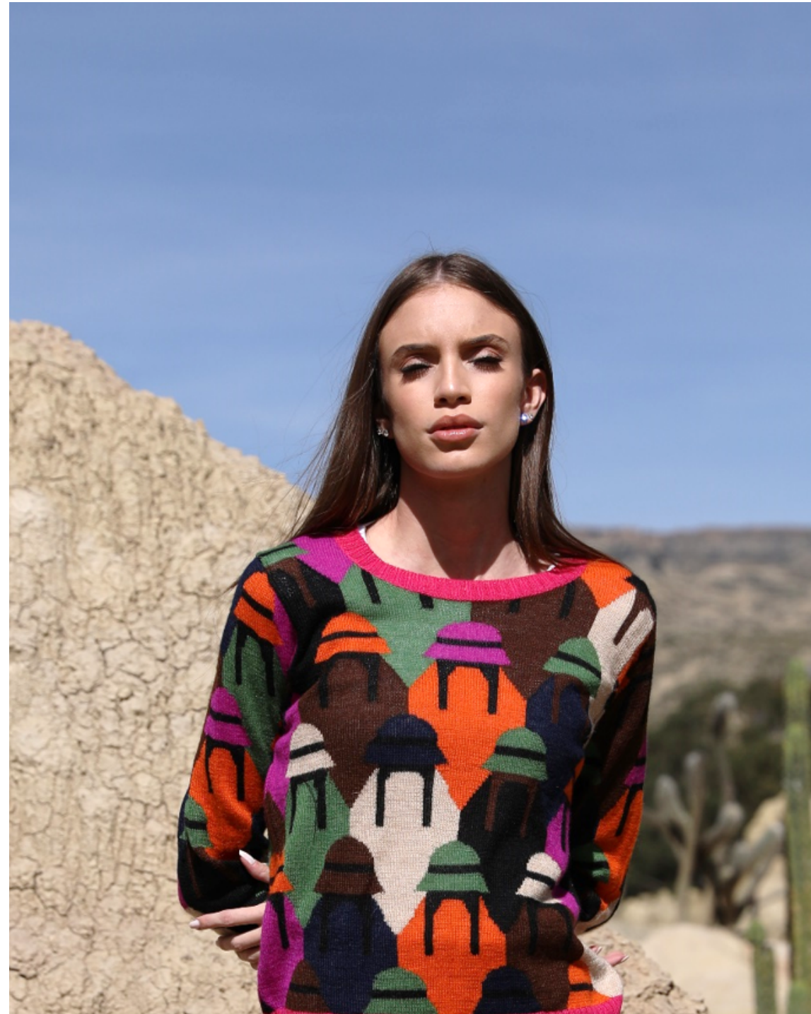
La Paz, "Ciudad Maravilla", Bolivia.